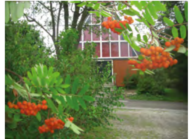
Kleinkirche St. Heribert